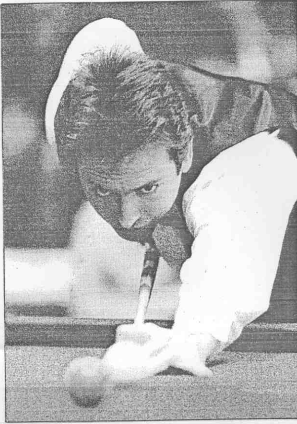
國際花式撞球賽最後四強，由美國韓特獨戰三位日本選手。