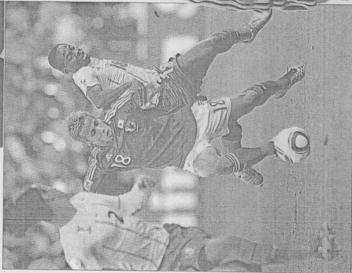
▲日本隊以1球擊敗「非洲雄獅」喀麥隆，為亞洲球隊的好表現添上一筆功績。