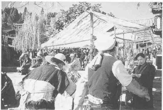
圖5. 四方街—世界文化名城