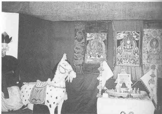
圖3. 納西族的祭天儀式

祭天在客觀上起著建構民族共同心理素質，加強民族內部凝聚力民族歷史傳統教育的積極作用（圖3）。