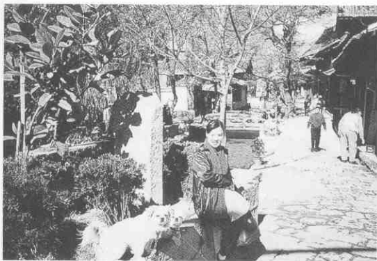
圖4. 四方街—世界文化名城

沿途見到納西族婦女匆忙趕路，身背重物，臉上刻劃著歲月痕跡，衣背上繡著七星的飾物，象徵披星戴月，更顯現納西族的母系社會地位（圖4）（圖5）。