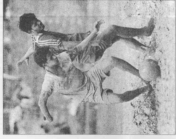
▲印度的球迷穿上自己喜歡的球衣，在泥濘地上踢起足球，世界杯期間，印度也有很多足球迷關心各國的賽事。

講烏克蘭語的民眾主張與歐洲接近，吸收新知，講羅斯語的民眾則布望靠近俄羅斯，擁抱傳統。但是，世界杯改變了這一切，烏克蘭就是烏克蘭，國家隊的勝利帶給民眾無比的信心。