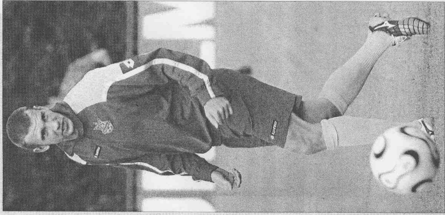
▲烏克蘭前鋒謝夫成科練球時，展現一流腳法，他堪稱是目前中歐足球壇的頭號射手。(歐新社)