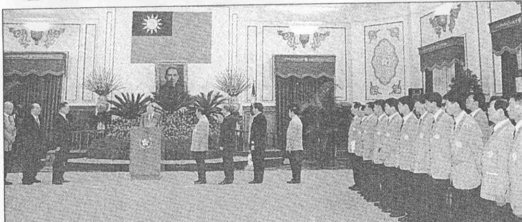
李總統昨主持中華奧運代表團授旗儀式，並預祝選手旗開得勝，締造佳績。