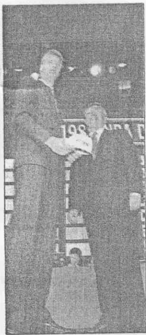
↑ NBA總裁史特恩(右)生財有道，獲得高薪。