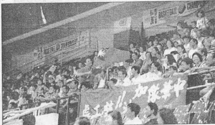
↑印尼華僑飛舞國旗為中華隊助陣加油。