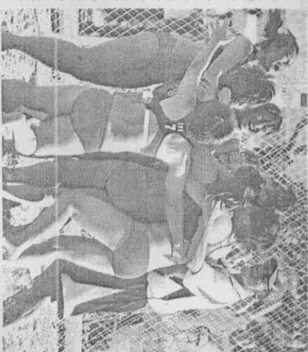
5. 開心擁抱在一起。中華女子沙灘手球隊慶祝獲第

今年高雄世運法式滾球採男、女2對2方式，滾球是直徑約7~8公分，重量約為600~800公克，目標球為木製、直徑2.5~3.5公分紅球，選手踩在50公分圓圈內，先丟擲目標