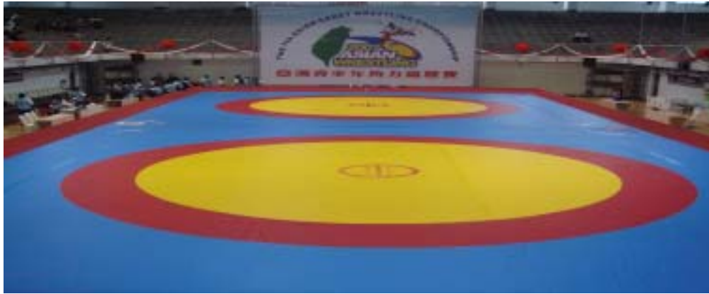
圖 3-1 角力比賽場地圖

角力場地長 12m 寬 12m，紅藍兩角落為雙方教練指導席，內圈綠色小圓為中心(比賽由此處開始)直徑 1m，黃色區域為比賽場地直徑 7m，外圈紅色區域為消極區寬 1 m，於紅色外圈渠於的部份為保護區