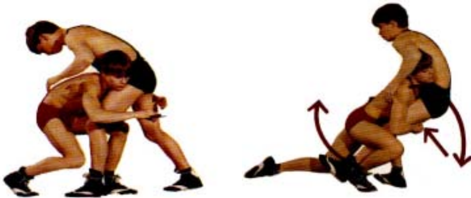
圖 2-1 角力擒抱摔之分解動作

以此動作為立姿專項運動測驗項目。(松浪健四郎，民 86)。 如圖 2-1 所示：