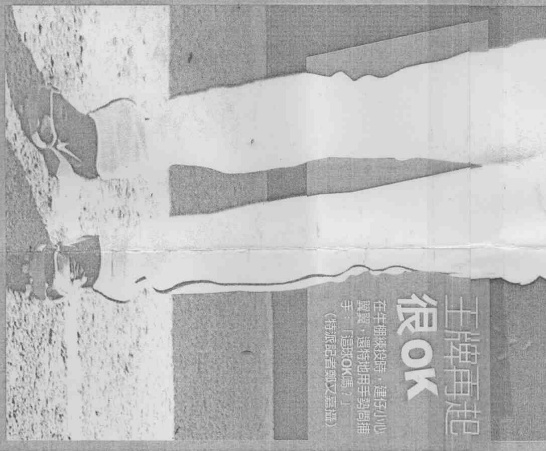
松坂昨天進牛棚練習，雖進度有些落後，自己仍覺得狀況不錯。

在牛棚練習時，建仔心翼翼，還特地用手勢問捕手：「這球OK嗎？」