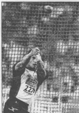
▲「鐵人」室伏廣至打破日本百年來田賽零獎牌的窘境，獲得男子鏈球銀牌。