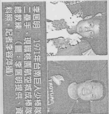
1971年台南巨人少棒隊二壘手，現職桃園航空城成棒隊總教練。

我當時主要守二壘，冠軍戰那個超級投手麥克林登（現為大聯盟老虎隊打擊教練）球速快極了，我也打得很不好。現在我看龜山少棒隊的對手都很強，整體水準都提高不少，尤其墨西哥