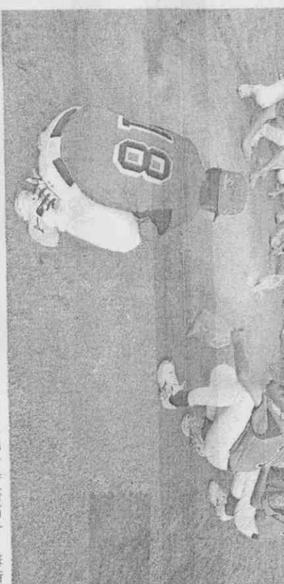
台灣隊小將們結束威廉波特賽事後，一起圍繞聚集在投手丘上收集紅土，當作紀念。