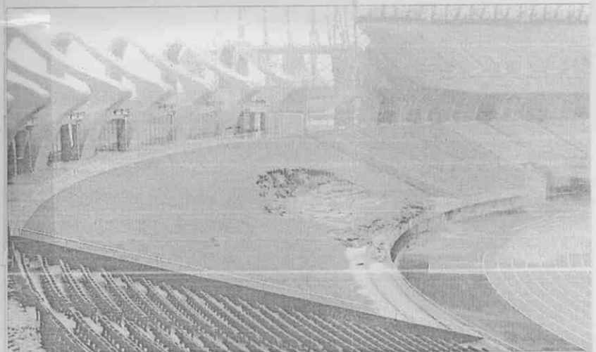
▲高雄市龍騰體育場的外野活動看台，因莫拉克颱風帶來的豪雨而坍塌一大塊。

戴遐齡指出，龍騰體育場目前尚未驗收，這次水災所造成的損害，承包的互助營造必須加以修復。戴遐齡也表示，莫拉克雖在南台灣寫下2000多毫米的降雨量，但龍騰所在的左營地區雨量約700毫米，場地這次嚴重受損，不能完全歸咎大雨。