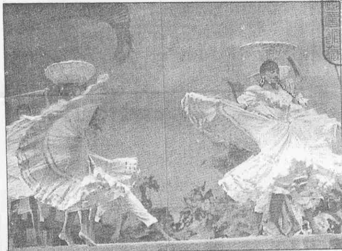
↑世界棒球錦標賽的選手之夜，大會安排的拉丁舞節目。