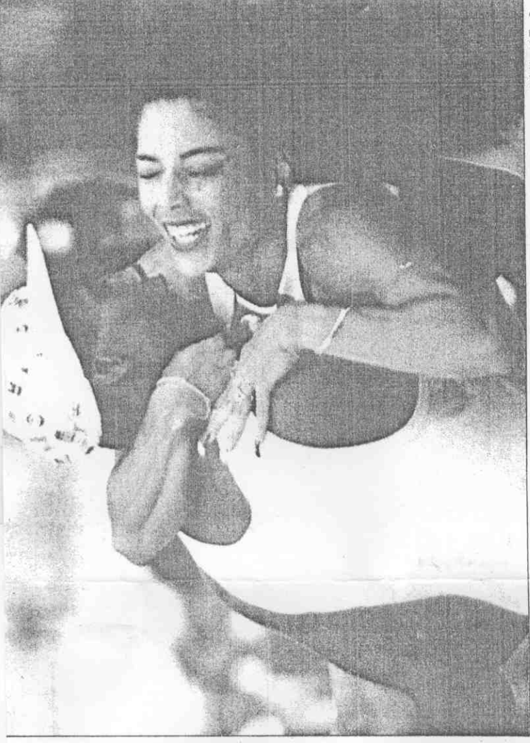
(真傳社透路)。來起抱她將把一夫丈丈練教的她，後錄紀世界下的創才己自新刷「蝶蝴蝶」↑