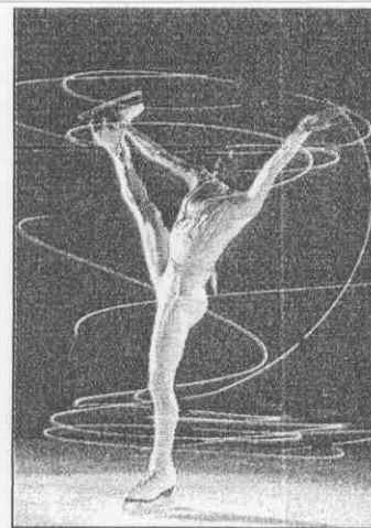
↑花式滑冰將在阿爾貝市舉行。