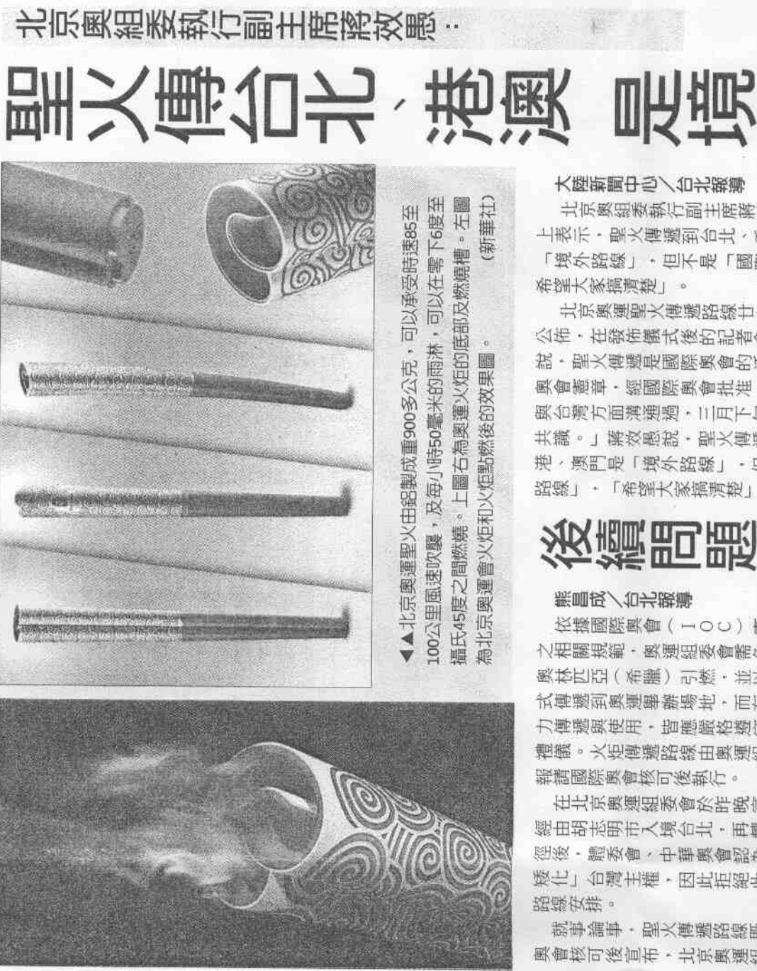
北京奧組委執行副主席蔣效愚：