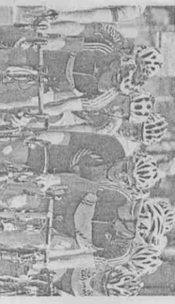
聽奧自由車選手在比賽中只需一個眼神就能與隊友溝通。