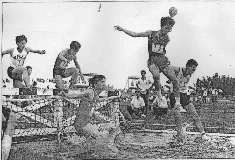
↑三千公尺障礙賽競爭激烈。