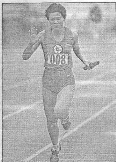
(攝岩少林 者記報本)。牌獎面四銅一銀一金二了拿就人個華淑王