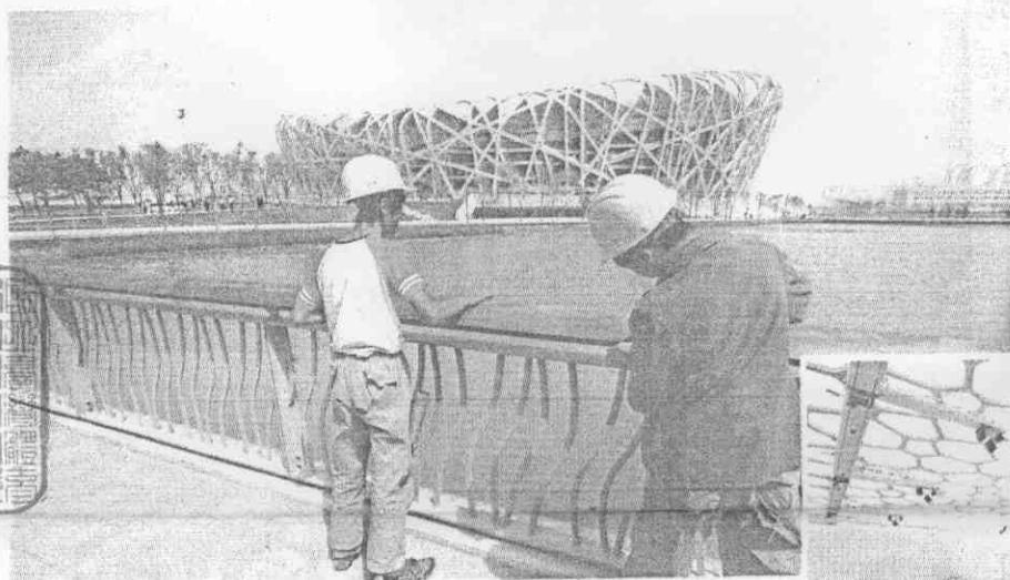
↑北京奧運開幕典禮場地「鳥巢」，主結構以不規則狀鋼構編織成鳥巢狀，共使用42000噸鋼筋，場內固定座位80000席，開幕時增加臨時座位11000席。奧運閉幕開幕典禮之外，田徑、足球決賽也在鳥巢舉行。距奧運開幕剩70天，兩名工人在鳥巢前加緊趕工。