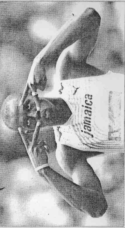
◀ 牙買加波特在男子200公尺輕鬆晉級。