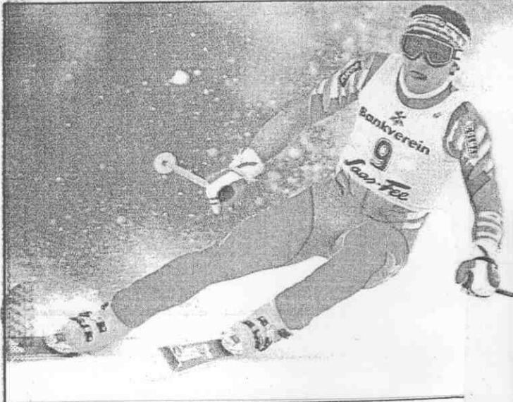
▲「小炸彈」湯巴風格驍悍，是當前義大利體壇的紅星。

歷來在冬運場上，包辦阿爾卑斯式滑雪賽三面金牌的選手，僅有一九五六年奧地利的塞勒（Toni Sailer）、一九六八年法蘭西的奇利（Jean-Claude Killy）兩人而已。這回在卡加立的艾倫山上（Mount Allan），卓布里根是否能一舉成為有史以來第一位囊括五面阿爾卑斯式滑雪賽金牌的選手，自是本屆冬運引人注目的焦點。