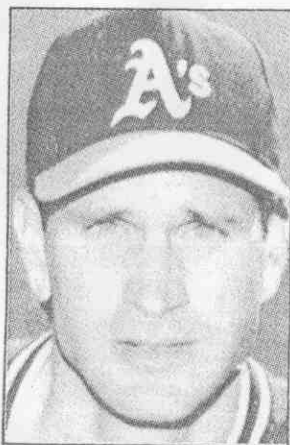
↑奧克蘭運動家隊投手威爾奇，13日獲選為美國聯盟最佳投手賽揚獎得主。

4年贏球廿場以上，他31次擔任先發投手，戰績22勝11負，平均責任失分2.36分，完投11場比賽，4場「完封」，主投267局中，三振166人，83次4壞，被擊出16支全壘打、226支安打。