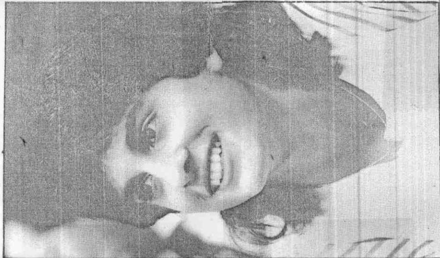
莎芭提妮吸引人的不止是她的球技，還有那份清純秀麗的面貌。

今年不過十五歲，進入職業網壇不過七個月，「網球女神童」莎芭提妮已經擁有以她命名的專屬球棒了。 昨晚穿著「莎芭提妮」發場，原本就清秀可人的女神童，不但顯得英氣煥發，女性的柔美韻味也十足，義大利名師設計師的手筆畢竟不同凡響，莎芭提妮的新風格益添悅目。 網球選手講究出賽服裝，是項傳統，因而職業網球賽場，不但美觀手藝技的地方，也是運動器材廠商互別苗頭的「戰區」：擊凡球拍、球衣、球鞋，廠商無不絞盡腦汁在此爭奇鬥勝，而成名的選手，更是他們藉以大地招徠的「活動廣告」。 品，實在是個生意眼，但是在這個以英文「T」字為商標的運動服裝公司，和其所屬球員之間，卻有個十分奇妙的現象，值得一書。 莎芭提妮和「T」牌簽約後崛起，並不是唯一的特例；即如現今網壇男子網壇的馬克左諾，今年以前，也是「T」牌的專屬球員。 而馬克左諾當初在和「T」牌簽約後，立刻就擊敗了當時的世界球王博格，並且連續三年於溫布頓大賽奪魁。 「女神童」莎芭提妮從兩年多以前，穿的也是「T」牌服，接下來她就成為「無敵女金剛」。