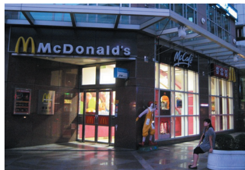
麥當勞台中中港門市

1992 年 4 月，臺灣第一家麥當勞臺北民生中心及永和與林森北路門市分別被歹徒放置炸彈勒索新台幣 600 萬元，造成一名警察死亡與兩位員工受傷，當時全省的 57 家麥當勞全部暫停營業，總部並懸賞新台幣 1200 萬元緝兇。這起事件曾經引起當時國內軒然大波，並成為全球矚目的焦點 (劉