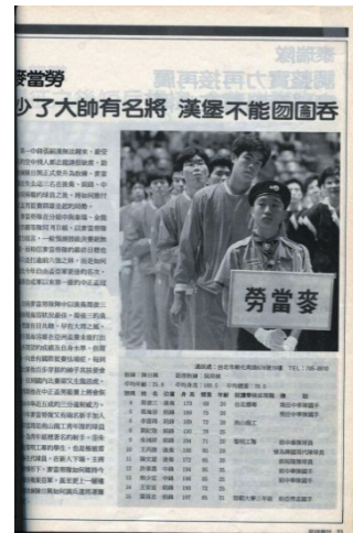
圖：1989 年參加中正盃開幕式（翻攝自籃球雜誌 42 期）

成軍三年的麥當勞男籃隊，在公司全盤考慮規劃運動經費使用，並重新評估麥當勞籃球隊經營效益的情形下，吹起熄燈號，於 1989 年 12 月 17 日宣布解散，並由宏國建設接手，從此麥當勞男籃名稱在國內成為絕響（李炎權，1989 年 12 月 17 日）。