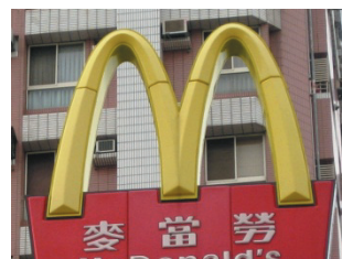
麥當勞大大的「M」字原本是創始店中金黃色拱門的造型

這種以加盟連鎖的方式推廣到全美以及全球各地的餐飲文化，在當時是一種新型態的餐廳經營模式，強調以販賣漢堡為主，取消需要刀叉的食物，並以紙杯、紙盤取代一般碗盤，並將工廠作業的模式應用到餐廳食品的準備工作，以標準