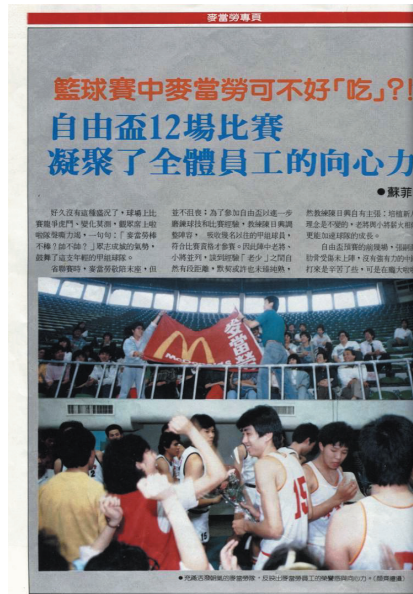
麥當勞的員工是最忠實的啦啦隊

意氣風發成立籃球隊，當年在國內速食業界呼風喚雨的龍頭大哥麥當勞，沒想到在首次比賽中一勝未得鐵羽而歸，慘遭墊底的命運！麥當勞公司經營階層與教練團絕對無法接受這樣的結果，這與公司形象與理念完全