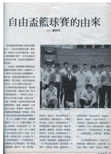
圖：1988 年自由盃榮獲冠軍