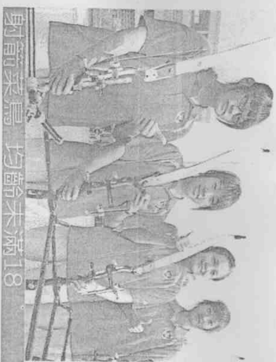
新竹市4名平均年齡不到18歲的小將，扳倒實力堅強的南投縣隊，拿下女子射擊團體賽的金牌。