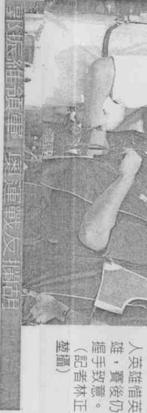
英雄惜英雄，賽後仍握手致意。