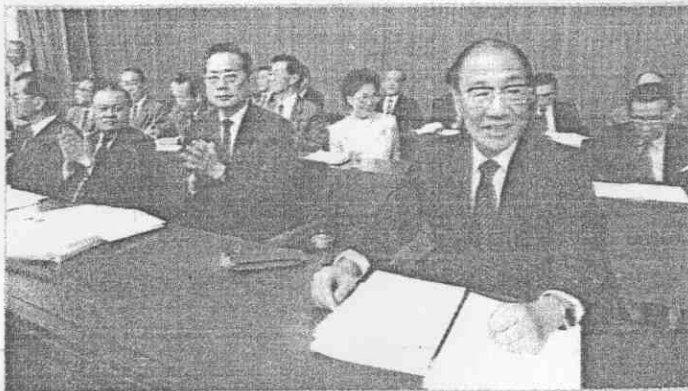
(攝勝勝邱 者記) 。席列長首會部各率華國俞院長政行，議開天昨院法立

【本報訊】行政院長俞國華昨天在立法院做施政報告時表示，政府正積極研究，今後凡我民間團體參加為會員的非政府國際組織，如果在大陸召開國際會議或國際體育競賽，均將派員參加；中央研究院