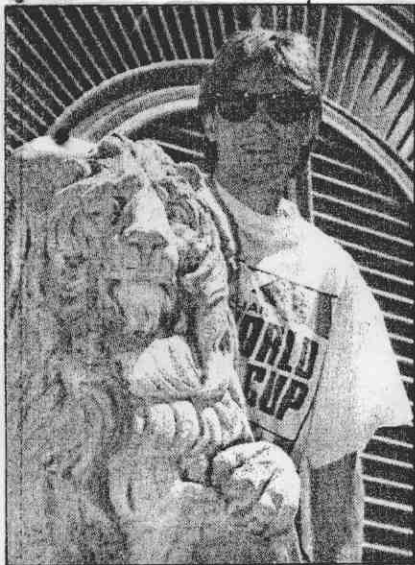
↑在對巴西之戰中進擊2球的南斯拉夫主將史托柯維克29日在投宿的飯店前留影。

戰南斯拉夫以4：1獲勝，蘇西克也進1球。已能調整步調，不急不徐，又適應義大利炎熱的天氣，成熟的蘇西克，在球場上正享受他足球生涯第2春。