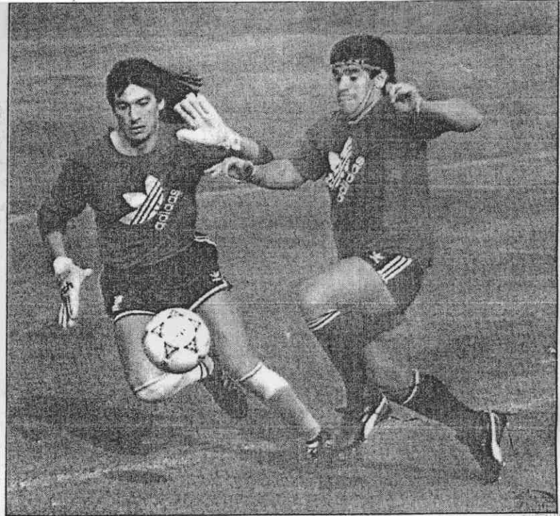
→阿根廷最佳搭檔◎卡尼佳(左)和⑩馬拉度納，29日在練球時逗趣輕鬆一下。