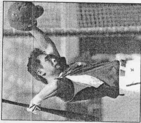
昨天是「恰恰」彭政閔的生日, 他依然為奧運熱身賽揮汗練習。

隊友張泰山則說:「每次大比賽嘟嘟都要對中國先發。」泰山的觀察不是胡說, 依照調整休息時間來看, 這次奧運潘威倫還是可能對上中國。