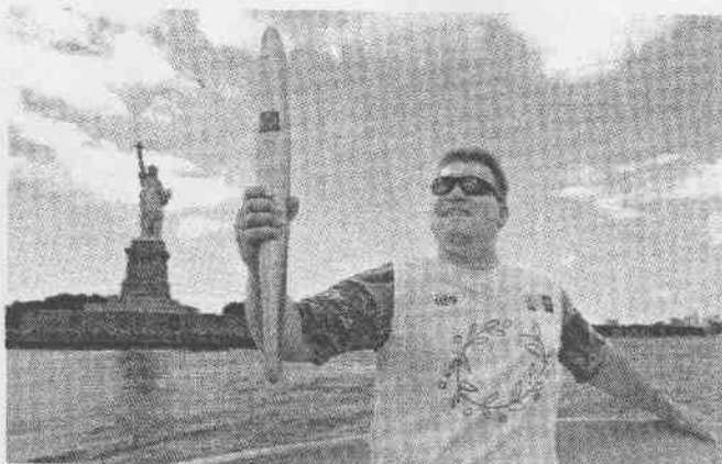
由女神像。 遞活動，沿途經過紐約市地標——自 ←一名聖火接力員搭乘船進行傳