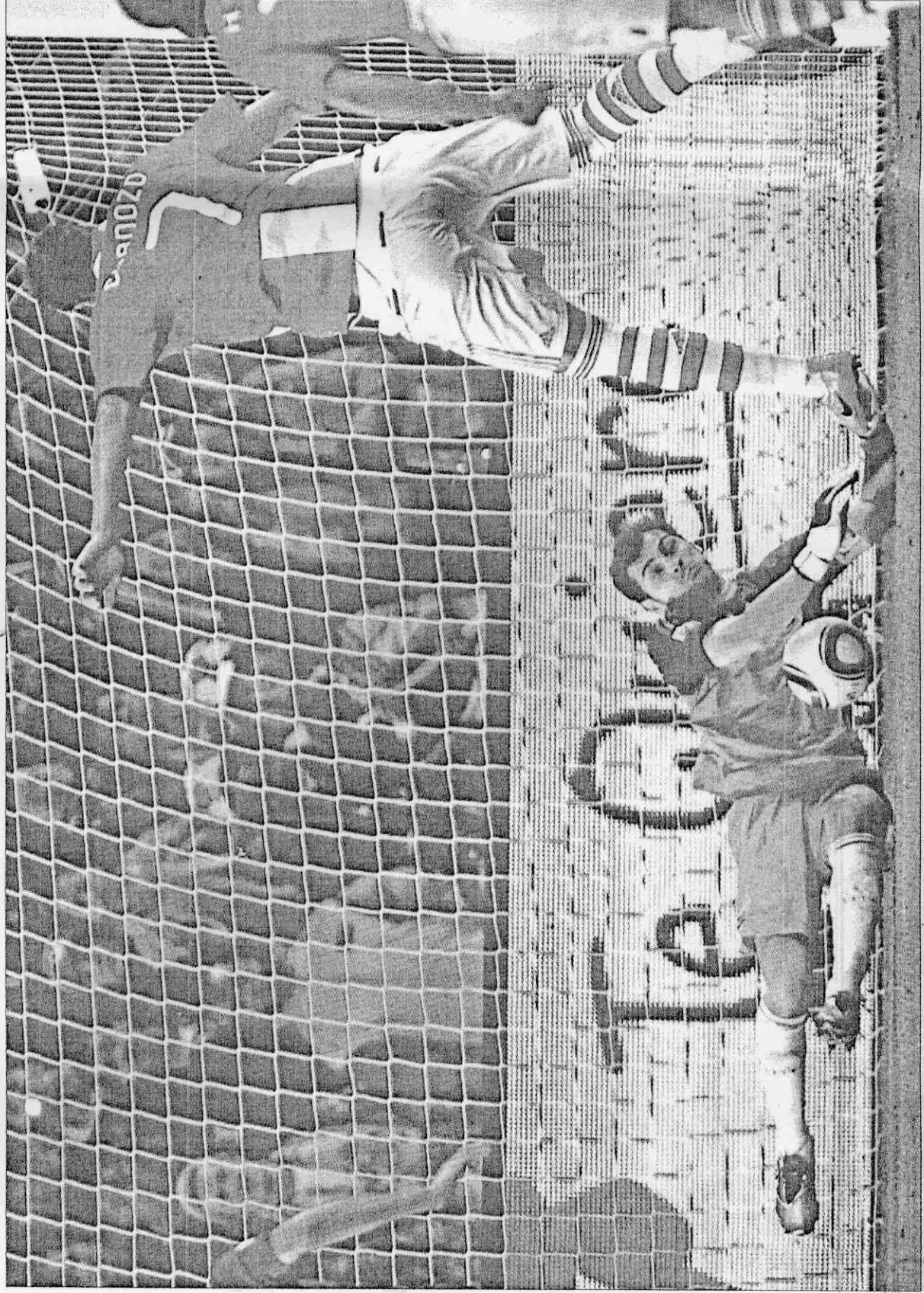
▲西班牙門將卡西亞斯奮力撲下巴拉圭卡多佐的12碼罰球，成為雙方氣勢消長的關鍵。