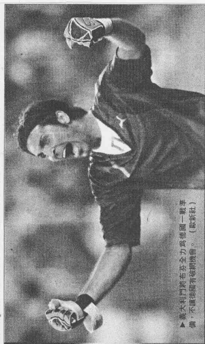
▶義大利門將布芬全力為德國一戰準備，不讓德國有破網機會。