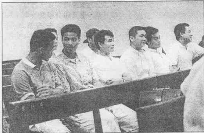
↑法院傳喚十四名球員到庭作證。

案，他不意外，至於康明彬應無；味全龍總教練徐生明也被要求做證；事後承審法官李英豪指出，從中華聯盟各領隊的證詞中不難發現，六支球團都有球員涉入賭博案，因此再整理相關資料後，將於二十八日庭訊傳喚被「點名」捲入賭博案的相關球員到案說明。（待續）