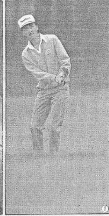
①陳志忠揮桿時風采迷人 ②陳志忠在洞加延賽中精彩表現 ③克爾蘭球後向陳志忠道賀 ④陳志忠研究草紋的神情。

【本報綜合外電報導】我國高球名將陳志忠，在海內外中國人的期待下，在美國時間廿二日（台北時間廿三日上午七點）贏得了洛杉磯公開賽冠軍。他是第一位在美國本土贏得冠軍的亞洲選手。