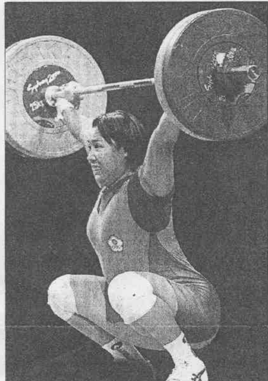
女子舉重七十五公斤級