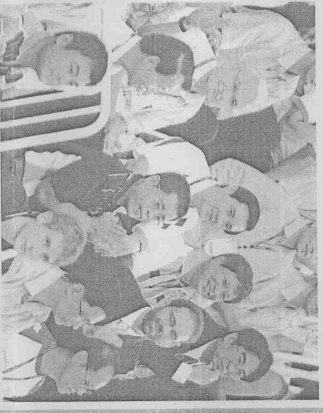
馬英九總統昨天前往中山大學體育館空手道和逸仙館健力的比賽場館，坐在觀眾席上觀戰，如果選手有優異表現會鼓掌加油，現場民眾也高喊「總統好」，大會並向外國選手介紹中華民國總統馬英九蒞臨會場觀賞比賽。

【記者呂珮利高雄報導】二〇〇九世界運動會昨晚閉幕，高雄市長陳菊昨天將高雄世運會的成功榮耀歸於市民及台灣社會。 昨天身兼二〇〇九世界運動會組織委員會基金會(KOC)董事長的高雄市長陳菊，應國際世界運動總會(IWGA)主席朗弗契之邀，出席IWGA記者會，暢談對高雄世運的感言。 朗弗契送陳菊由IWGA所製作的獎牌，感謝她的傑出表現。陳菊回贈朗朗的一對高世運吉祥物「水精靈」。