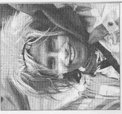
▲▼阿根廷（上）和德國球迷，用鮮豔的裝扮為球隊加油。