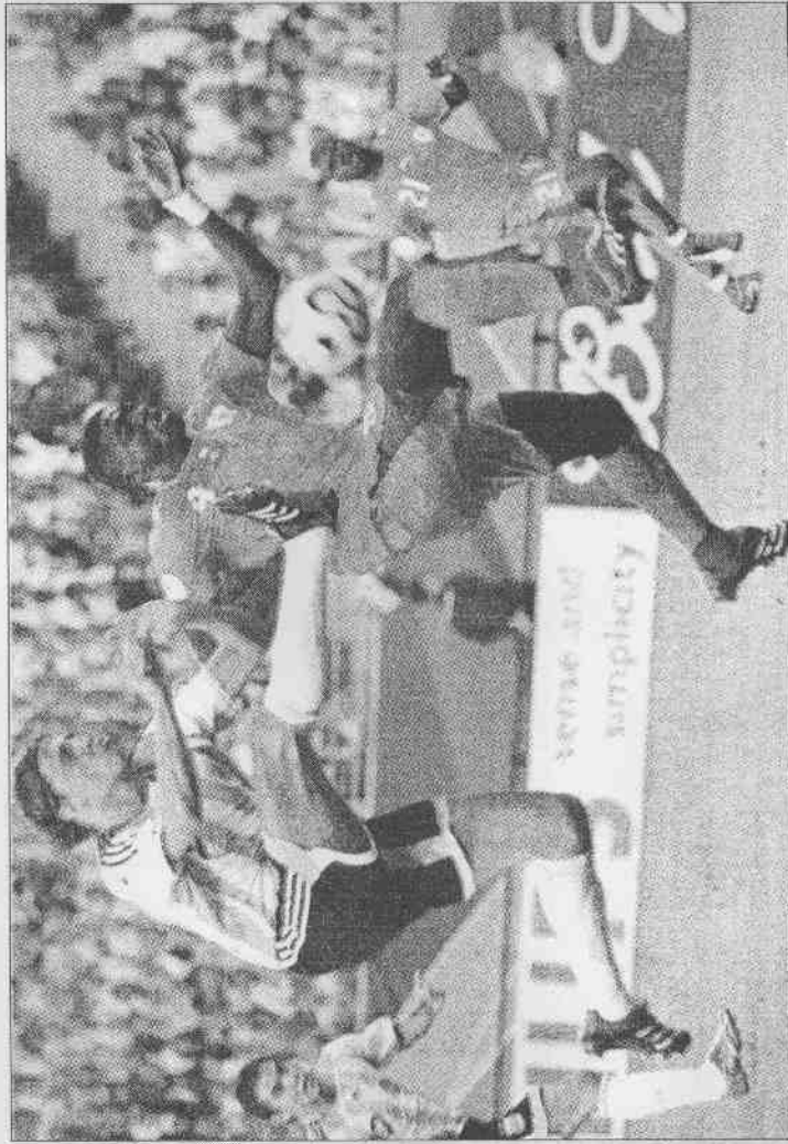
▲德國球星克洛斯(右)的攻擊力，將帶給瑞典隊極大壓力。