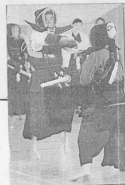
←劍道團體賽，基隆市的女選手(左)跳起來與桃園縣的選手交戰。