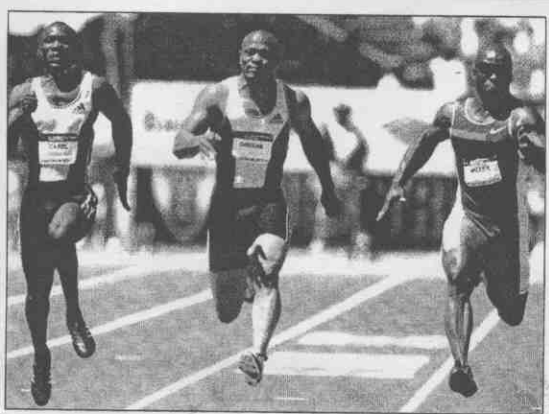
世界三強地位。望在各自強項田徑、體操、桌球大有斬獲，穩坐三名美國、俄羅斯、大陸競爭更加激烈，分別寄望。▲雅典奧運即將點燃戰火，上屆雪梨奧運前