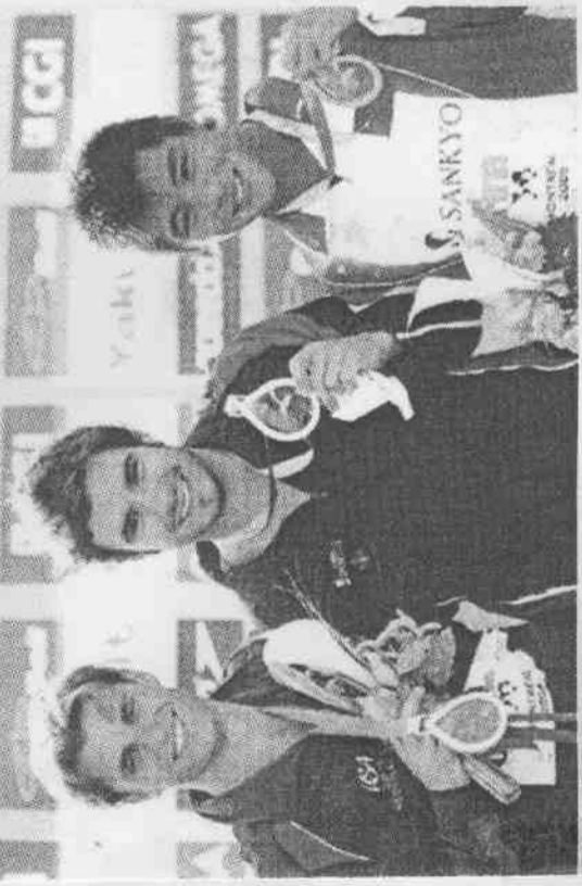
加拿大選手德斯帕蒂(中)贏得男子三公尺跳板金牌，與亞軍杜達斯(左)和第三名何冲合影。