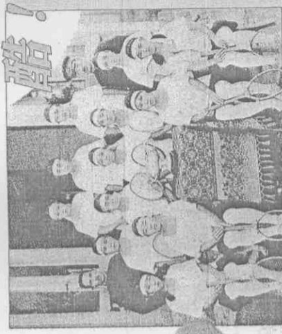
◀1927年台南第二高等女學校的庭球隊(網球隊)奪得獎杯後，與教練在學校合影。