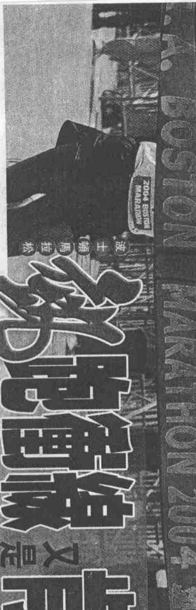
波士頓 馬拉松 選手 恩德瑞芭