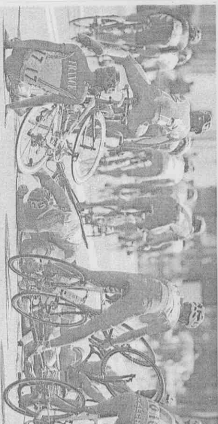
男子自由車賽事發生摔車意外，幾位選手撞成一團。