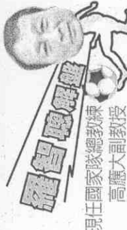
現任國家隊總教練高麗大副教授

握機會，門前單刀竟然沒能進球，相當可惜，然而，荷蘭必須派重兵在中場防守，讓羅本的進攻只剩單點，少了跟進的球員，威脅就沒那麼大。