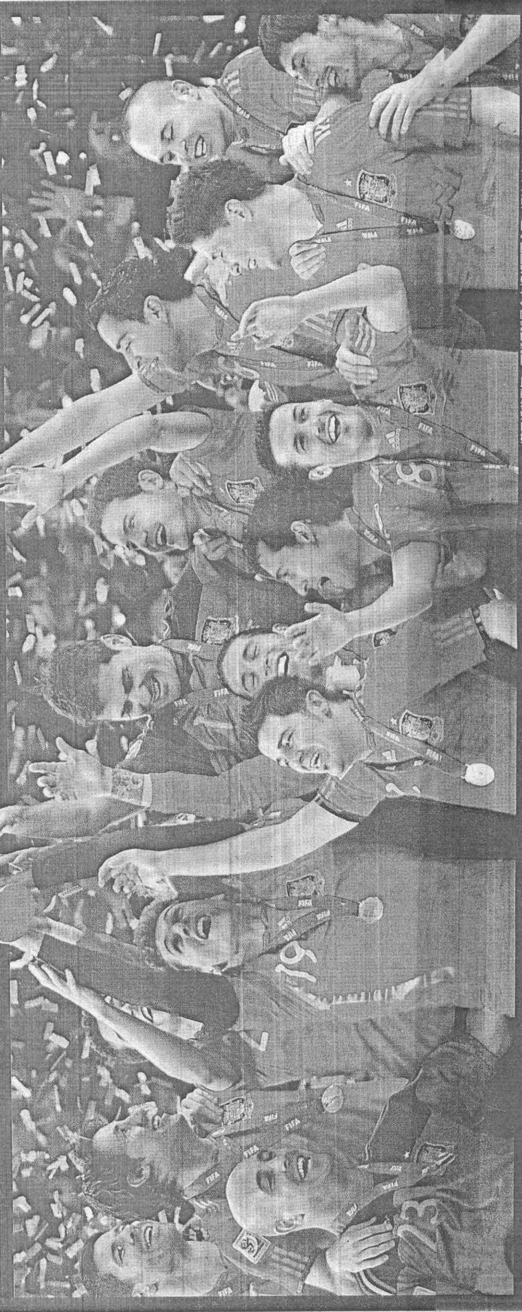
滿天紙花飛舞，西班牙球員合力捧起冠軍盃，迎接史上第1座世界盃冠軍。