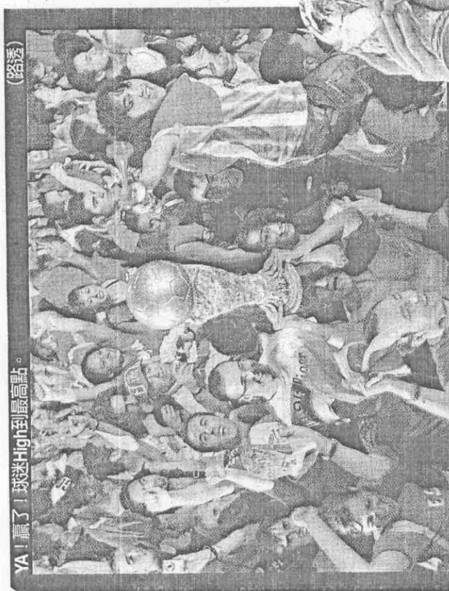
YA!贏了!球迷High到最高點。