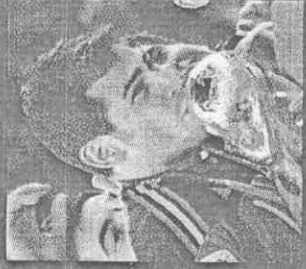
卡西亞斯在卡波內羅採訪他的時候公開獻吻。

卡波內羅在西班牙電視台擔任賽後採訪工作，曾被選為全世界最佳的新聞從業人員，她到南非採訪世界盃，被批評「假公濟私」，因為西班牙禁止大嫂團同行，而西班牙小組賽首戰瑞士以0：1意外輸球後，卡波內羅成為眾矢之的，被認為造成卡西亞斯無法專注攻勢。