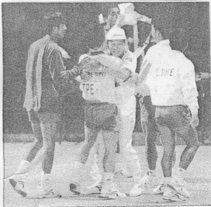
↑中華男子軟網隊擊敗日本後，全隊欣喜不已。