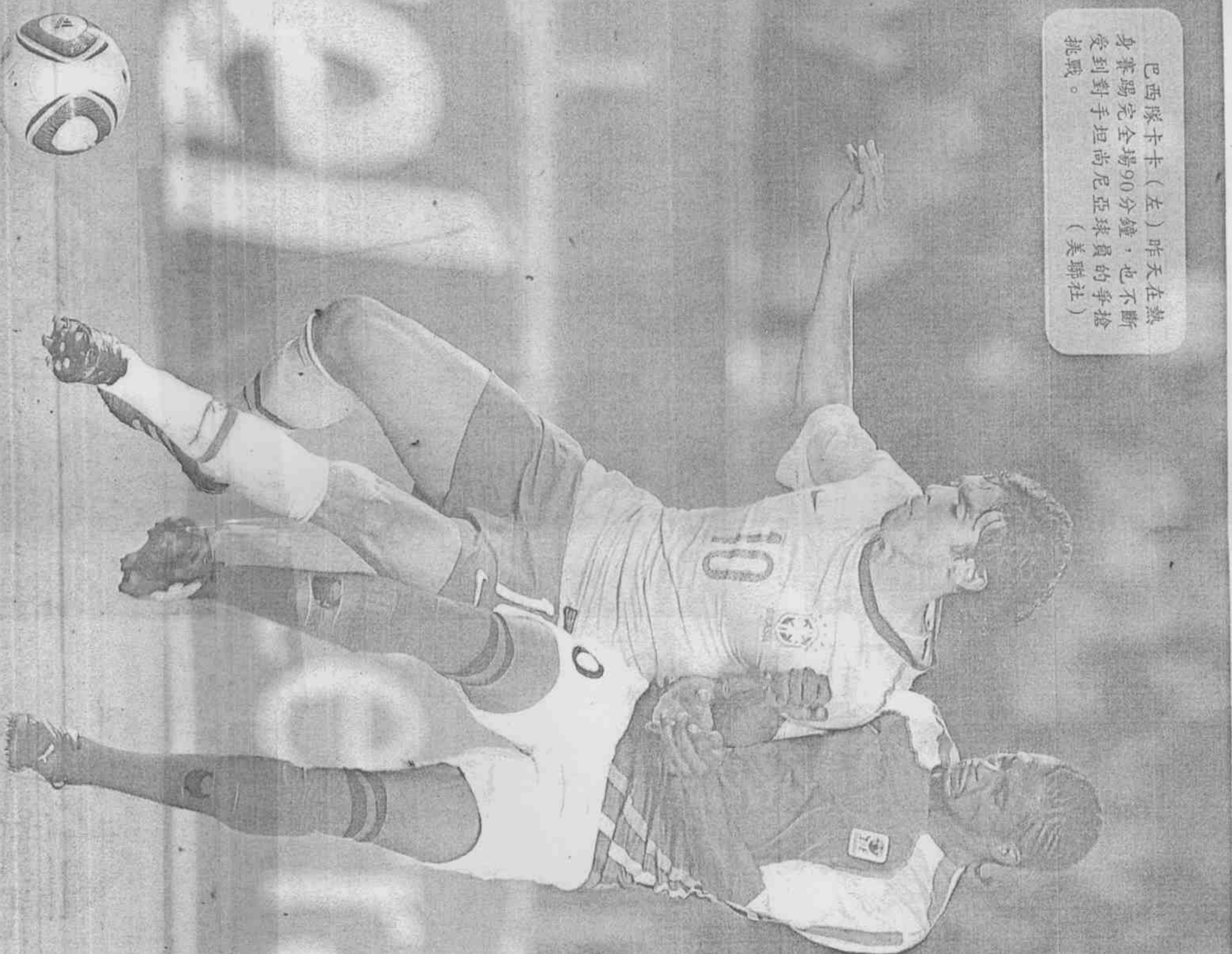
巴西隊卡卡（左）昨天在熱身賽踢完全場90分鐘，也不斷受到對手坦尚尼亞球員的爭搶挑戰。

他比別人多受高等教育卻從不自負富裕；身為白人卻在黑人、黃人也非少數的巴西生活，引發種族歧視爭議言論，從未來自卡卡口中。娶嬌妻卡羅琳後未曾鬧出緋聞，喜獲麟兒家庭美滿。即便大牌到去年皇家馬德里為了