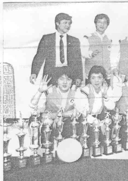
▲中華保齡球隊在國際賽中全勝，獎杯琳瑯滿目，他們戰果豐碩。