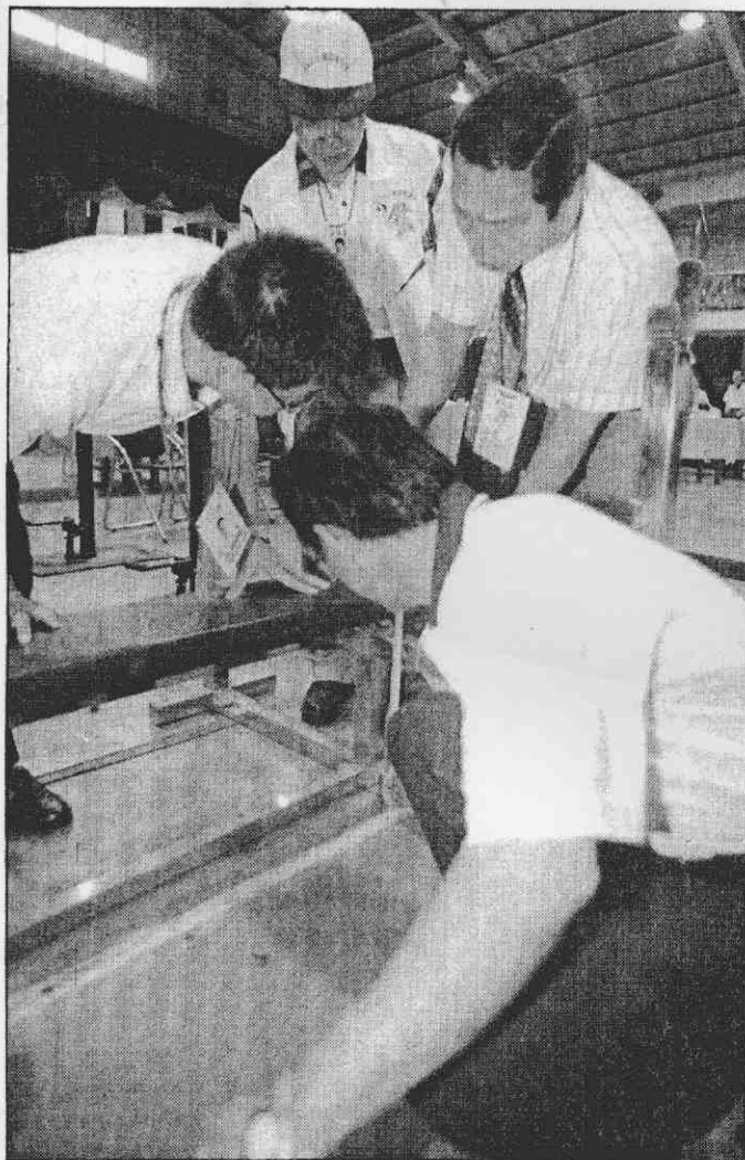
↑區運部分健力器材，大會裁判人員認為不符規定。

對北縣、高市的巧取豪奪，奪牌難度高出許多；桃園縣前年辦區運時盛極一時，去年滑落為第六，今年希望挺升到第四名。